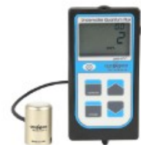
Handmeßgeräte mit integriertem oder externem Lichtsensor